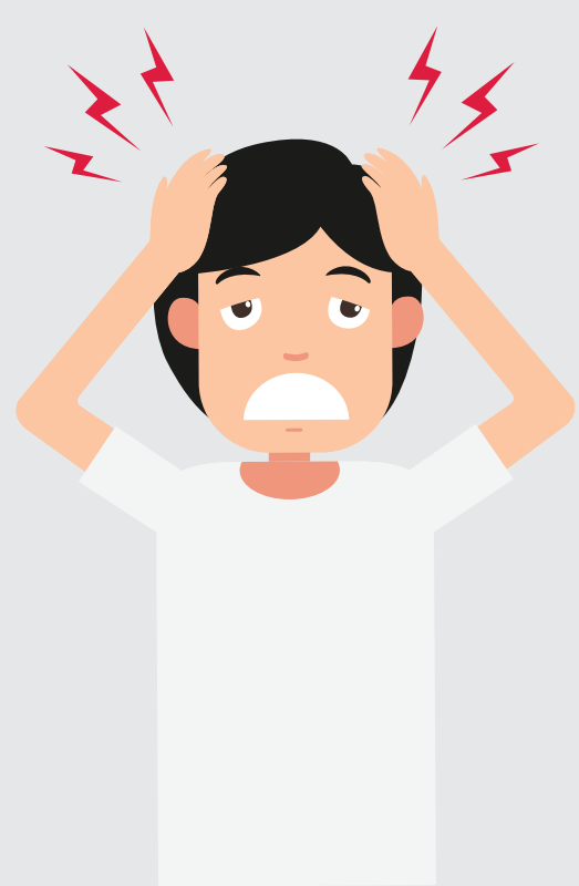
DORES DE CABEÇA